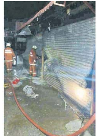
■ 消防员正查看是否有人受困在灾场。

打烊，未釀人命伤亡：当局正在调查起火原因和估计损失。“武吉斯 (Bugis)” 概念设立的商业中心，提供小型企业家创业的机会，增加收入，也造就更多就业机会。去年，时任雪州大臣拿督斯里阿兹敏阿里出席重建土礼时说，完工后的莎阿南上城共有两层高，涵盖460个摊位，包括楼下240个摊位、楼上220个摊位，还有其他设备如舞台、办公室、祈祷室、厕所和公园，并提供519个停车位。