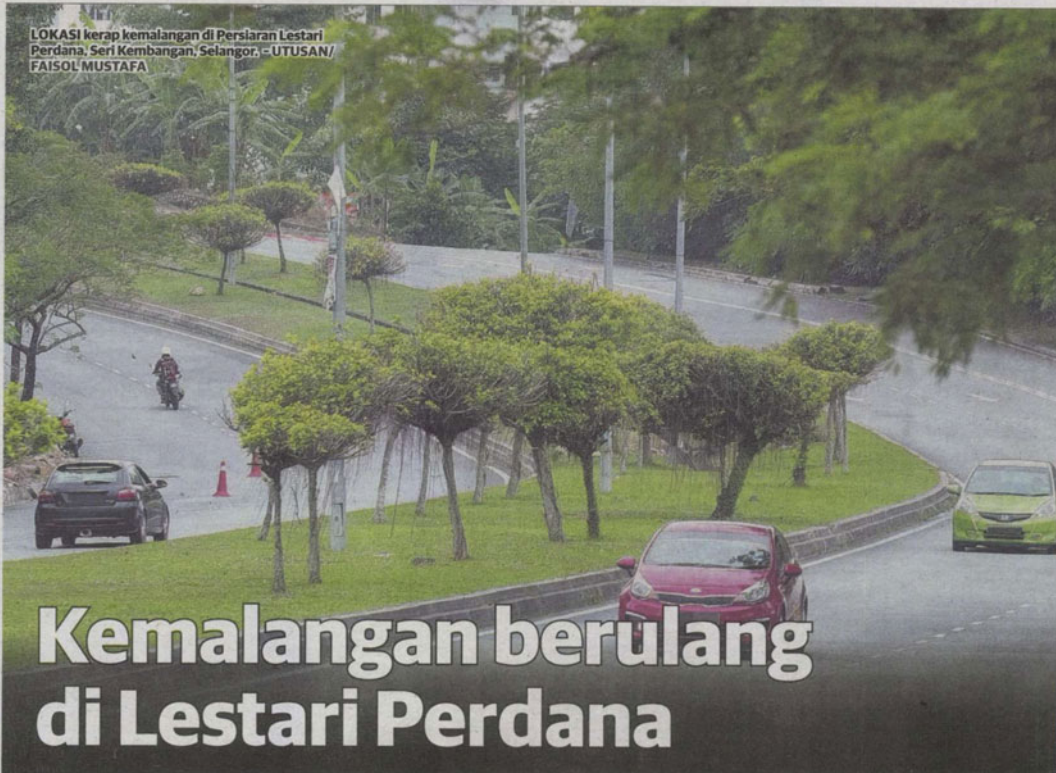
LOKASI kerap kemalangan di Persiaran Lestari Perdana, Seri Kembangan, Selangor.