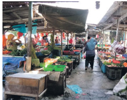
Pasar pagi di Jalan Papan, Pandamaran akan dinaik taraf demi keselesaan peniaga dan pengunjung.

projek naik taraf pasar itu dijangka siap penghujung Januari tahun hadapan.