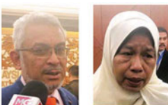
卡里沙未驳斥精明隧道发生水灾的谣言。

昨日一场豪雨导致多个地区发生闪电水灾，联邦直辖区部长卡沙未表示，根据初步调查结果，隆市的排水系统堵塞，而该部将会对涉及的承包商开罚。 他坦言，尽管昨日身在纳闽参与市会议，但仍心系隆市的闪电水灾情况，并且不时与吉隆坡市长联系，以获取最新情况。 “虽然我回到隆市已经很久了，但隆市水灾还是时不时传进隆市水灾的照片给我，以便让我了解最新情况。” 他今日在国会走廊受询时表示，他已经与吉隆坡市政府了解昨日的水灾情况，并获悉水灾是因为一些工程计划导致排水系统堵塞，水无法排出而导致情况非常严重。 “我已经指示涉及的工程停工，以进行调查。” 卡沙未也有坦言，隆市的排水系统有10年历史，且年久未提升，再加上昨日的大雨“非比寻常”，因此才会有如此严重的情况。 “据我了解，昨天的大雨下了超过2个小时，是不寻常现象。” 无论如何，他表示，隆市的排水系统会逐步提升，惟需要一段时间。 卡里沙未驳斥谣言 针对社交媒体传精明隧道(Smart Tunnel)发生严重水灾，导致车辆遭“灭顶”的图片，卡沙未则驳斥这些指控，并指这些乃假新闻，而精明隧道公司也已经做出