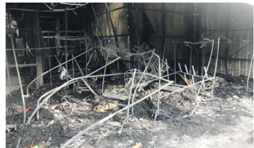
Antara gerai yang musnah dalam kebakaran semalam.