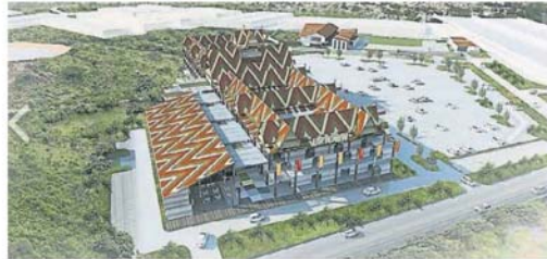
■ 重建后的莎阿南上城设计图。

原有的莎阿南上城是在2006年启用，设有442个摊位，但在2014年10月的火灾中，烧毁约182个摊位。较后，州政府斥资3000万令吉重建，作为最新的旅游景点。