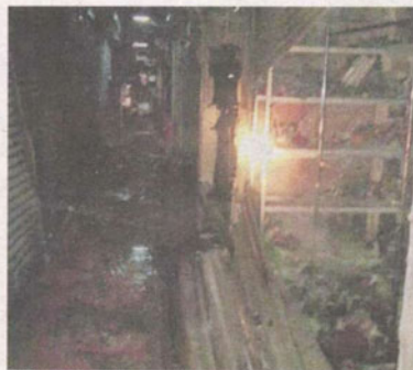
SEBAHAGIAN daripada lot niaga Uptown Shah Alam yang musnah dijilat api dalam kejadian kebakaran yang berlaku pada pukul 5.30 pagi semalam.