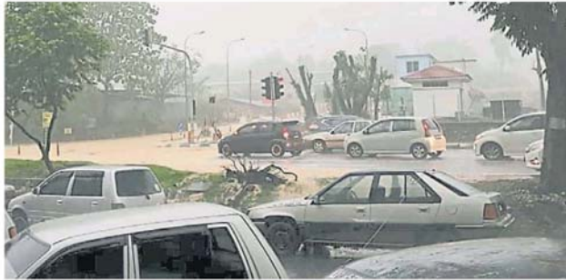
东北季风来袭，雪州各区频频发生水灾，尤其午后下雨，马路积水影响交通。

“参与防范措施的各个单位包括消防局、警方、民防部队等，共 2700 成员，预计可动用的疏散工具达 453 个，同时，备好开放的疏散中心也有 500 余个，可容纳高达 9 万 7000 人。”