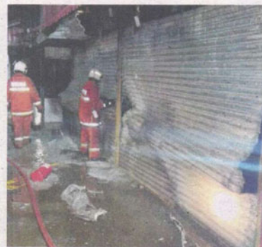
ANGGOTA bomba memeriksa lot kedai Uptown Shah Alam setelah api berjaya dipadamkan.