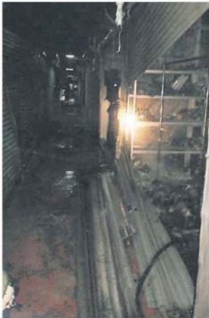
■ 莎阿南上城再遭火魔来袭，共有35个摊位烧毁。