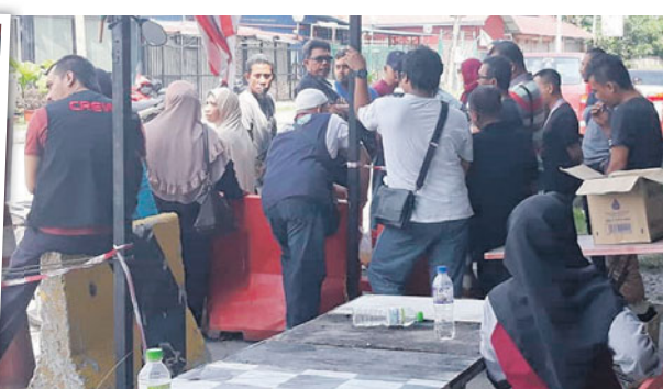
Sebahagian pemilik kedai masih menunggu perkembangan lanjut di luar kawasan Uptown Seksyen 24, semalam.