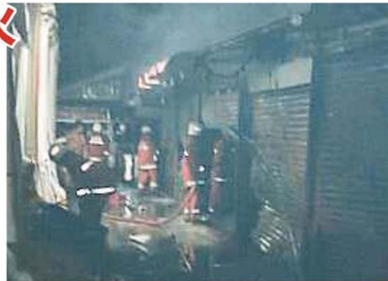
▲沙亞南第24區Uptown的35間商販營業單位被大火吞噬。

他補充，這次已是該區第三次發生火災了，第一次發生於2014年，當時有196間單位受到波及；第二次則發生於2016年，有4間單位被燒。