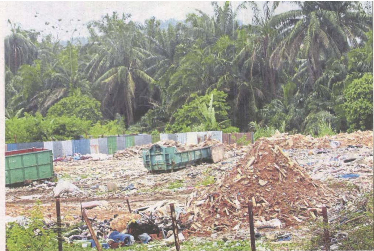
Construction waste being disposed at the vacant plot in Kuala Selangor.