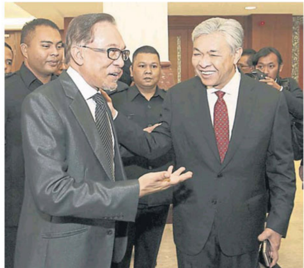
安华（左）与阿末扎希在国会走廊寒暄。