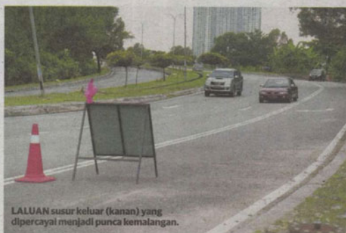
LALUAN susur keluar (kanan) yang dipercayai menjadi punca kemalangan.

"Ia mungkin disebabkan oleh pemandu di Persiaran Lestari Perdana yang terkejut dan gagal