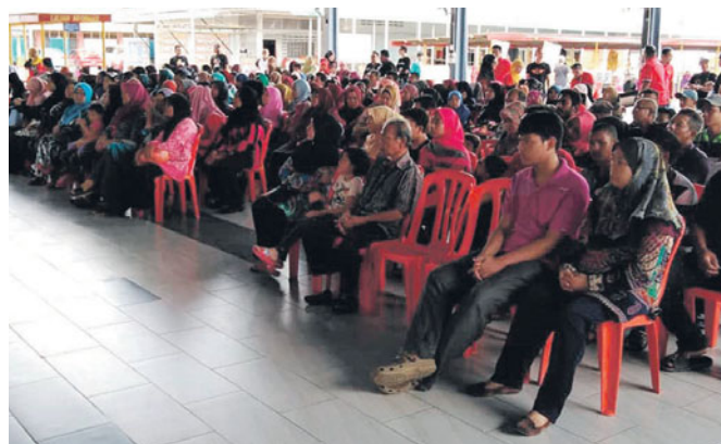
Sebahagian penerima bantuan makanan disalurkan Perkuasa dengan kerjasama Komuniti Rakan Bersih Kubur Selangor.

“Insya-ALLAH kita akan meneruskan lagi program seperti ini pada masa akan datang,” katanya.