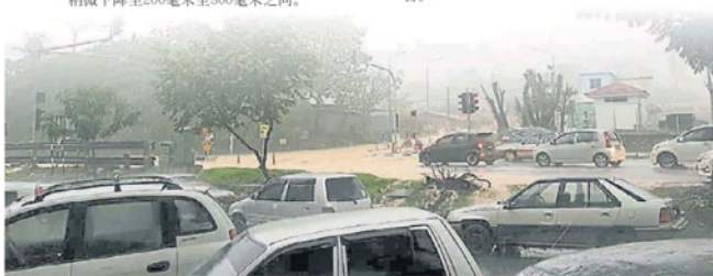
东北季风来袭, 雪州多区频频发生水灾, 尤其午后下雨, 马路积水影响交通。

他指出, 作为预防措施, 水灾危险地区的负责单位如水利灌溉局、公共工程局及地方政府等已受促做好清理工作, 包括除草、修建美化树、清理沟渠垃圾等, 确保排水道没有受阻。