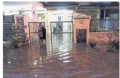
民众受促在雨季期间提高警惕，做好防范工作。（档案照）