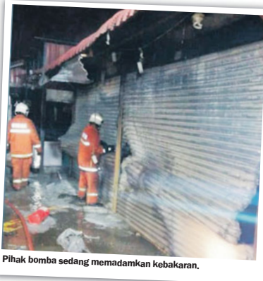
Pihak bomba sedang memadamkan kebakaran.

"Bagaimanapun punca kejadian masih belum diketahui dan kita akan menunggu siasatan JBPM yang dijangka mengambil masa seminggu atau lebih," katanya.