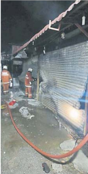
消防人员巡视被烧毁的摊位。

时任雪州大臣拿督斯里阿兹敏阿里曾于去年受邀主持重建动土仪式，莎阿南上城主要分为两层楼高，涵盖 460 个摊位，其中楼下 240 个，另设其他设备，如舞台、厕所和公园；楼上有 220 个摊位，有办公室、祈祷室及厕所等，此外还提供 519 个停车位。